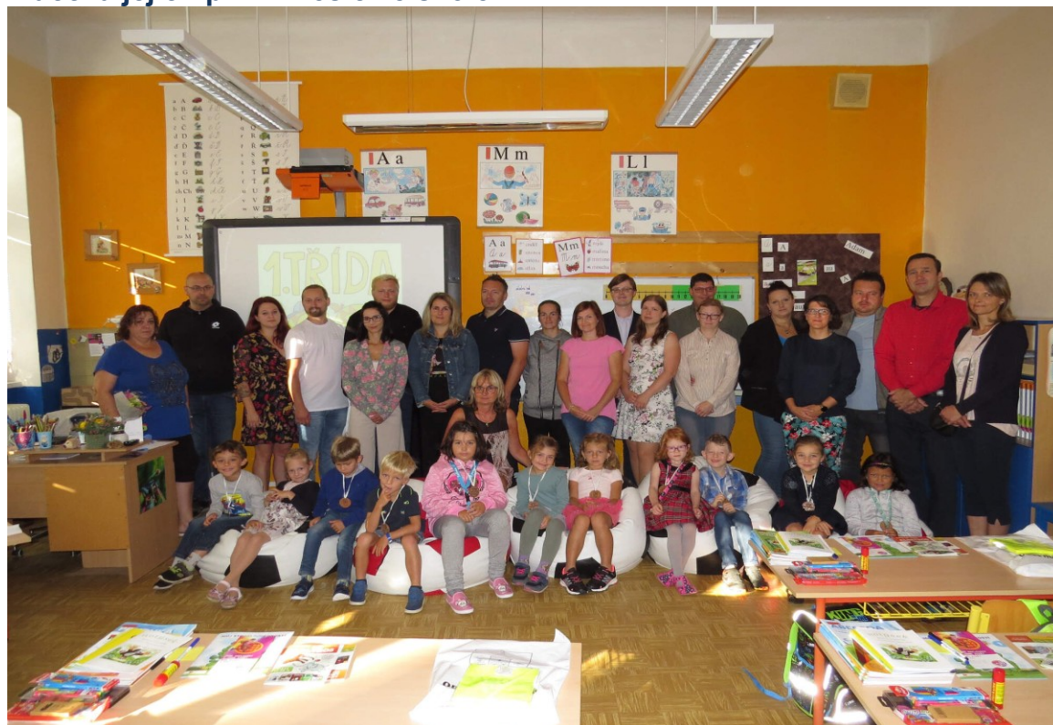
Slavnostní přivítání prvňáčků 4. září.