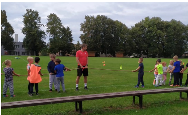
Profesionální trenér při výuce Tv na 1.stupni naší ZŠ