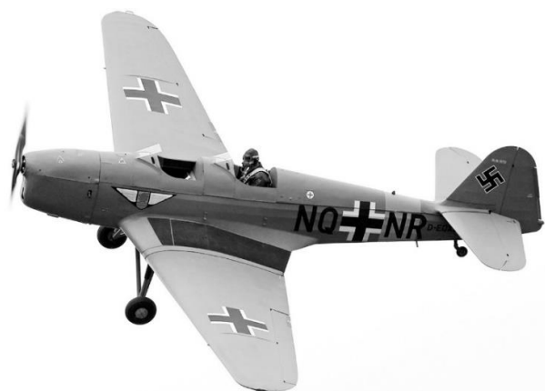
Jednoplošný Klemm Kl 35 a dvouplošný Bücker Bū 131 byly do poloviny války základem výzbroje většiny pilotních škol Luftwaffe. Později je doplnily moderní, celokovové cvičné stroje Arado Ar 96 nebo Bücker Bū 181.