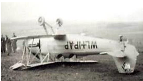
Poškozená, nekvalitní fotografie převráceného letadla Gotha Go 145 je unikátním dokladem havárie u Hořepníku.